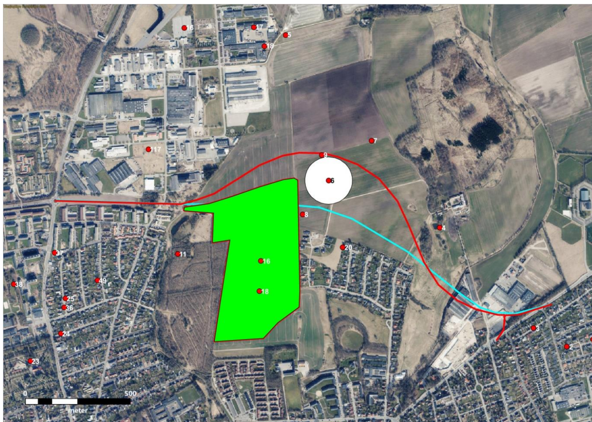
Figur 1: På kortet ses de to vejforløb, som behandles i kommuneplanen samt de omkringliggende fortidsminder. Arealet markeret med grøn er tidligere undersøgt af museet og frigivet til byggeri.

Af særlig væsentlighed skal det nævnes, at de to fremlagte forløb af ringboulevardens udvidelse løber igennem eller nær ved en større bebyggelse primært fra ældre og yngre jernalder, og med indslag fra bondestenalder og bronzealderen (-18). Bebyggelsen bestod af komplekse flerfasede indhegnede gårdsenheder samt enkelte grave fra jernalder og bondestenalder. På samme mark er desuden gjort fund af en bjergartsøkse fra bondestenalderen (-16). Museum Østjylland udgravede lokaliteten i 2021-2022, hvilket har betydning for alternativ 2, hvor dele af omfartsvejen dermed allerede kan frigives til byggeri.