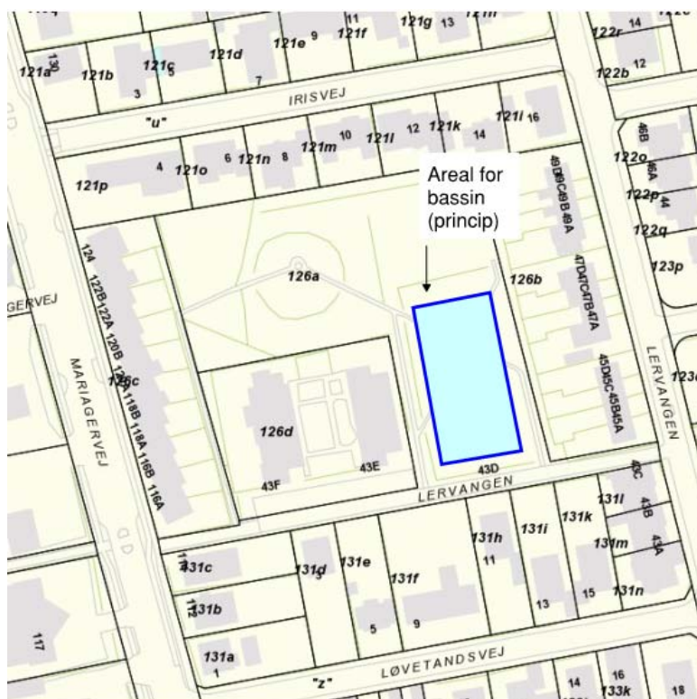
Figur 2: Omtrentlig placering af bassin ved Lervangen

Der etableres to underjordiske bassiner i oplandet. Det ene bassin placeres i delopland V23.4 og det andet i delopland O11. Placeringen af de to bassiner er vist på nedenstående skitser. Formålet med bassinerne er at kunne kontrollere stuvningen i området.