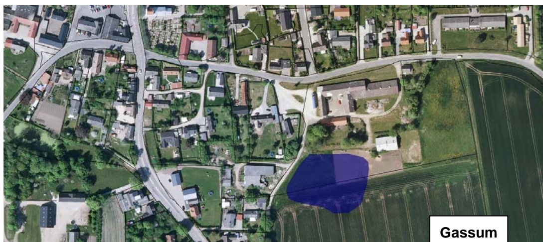
Billed 4.2. Fremtidige østlige regnvandsbassins omtrentlige størrelse og placering vist med blå. Gassum

Bemærk at ovenstående oversigtskort er ikke i samme målestok.