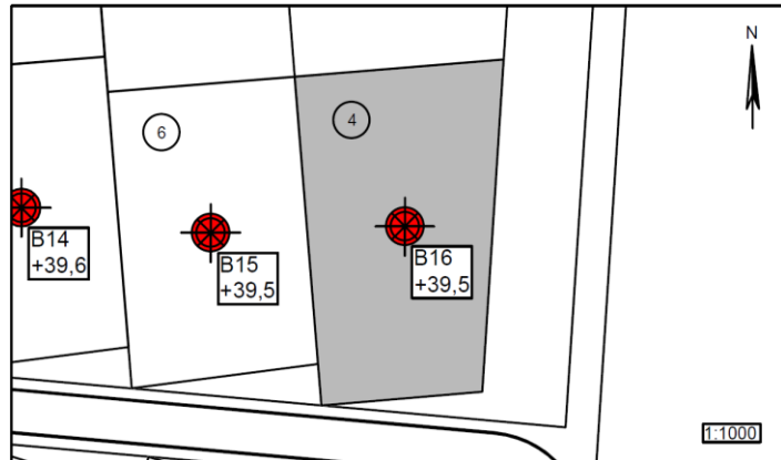
Figur 1 – Situationsplan 1:1000

Parcel nr.: 4 Boring nr.: B16 Overside bæredygtige lag (OSBL), kote: +39,2 Dybde til OSBL, m: 0,30