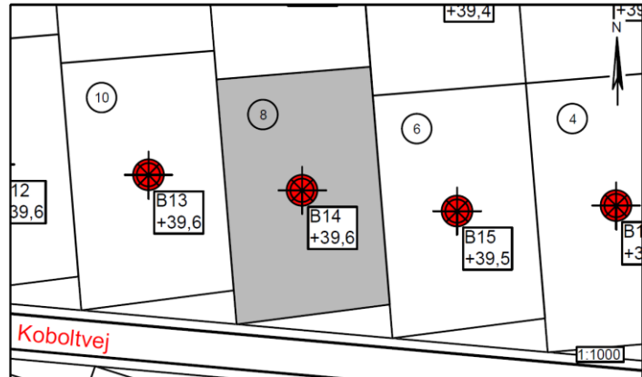
Figur 1 – Situationsplan 1:1000

Parcel nr.: 8 Boring nr.: B14 Overside bæredygtige lag (OSBL), kote: +38,9 Dybde til OSBL, m: 0,70