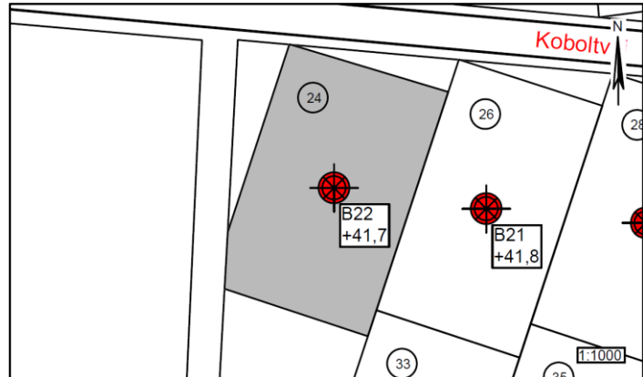
Figur 1 – Situationsplan 1:1000