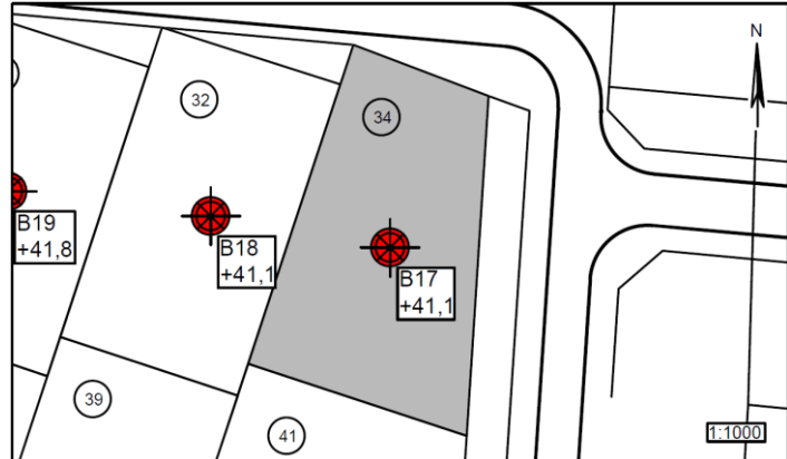
Figur 1 – Situationsplan 1:1000

Parcel nr.: 34 Boring nr.: B17 Overside bæredygtige lag (OSBL), kote: +39,9 Dybde til OSBL, m: 1,20