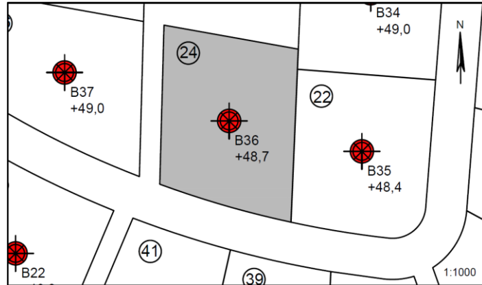
Figur 1 – Situationsplan 1:1000