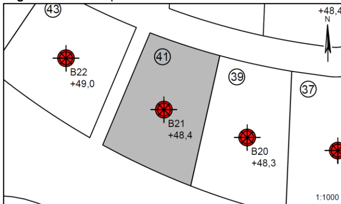
Figur 1 – Situationsplan 1:1000

Høgshøjvej nr.: 41 Boring nr.: B21 Overside bæredygtige lag (OSBL), kote: +47,8 Dybde til OSBL, m: 0,60