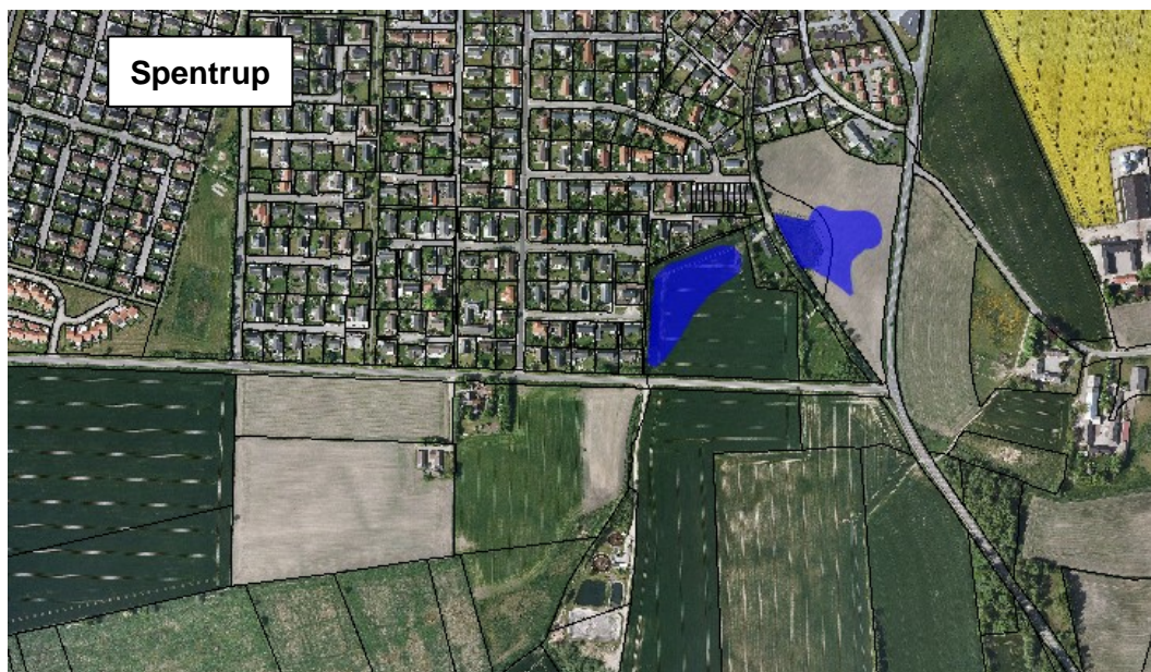
Billed 4.1 De fremtidige regnvandsbassiners omtrentlige størrelse og placering vist med blå.