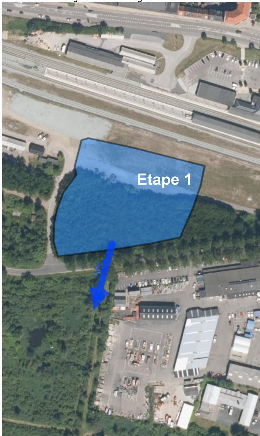
Figur 2: Udformning af bassin. Bassin nord for Hvidemøllevej vil kunne modtage tag- og overfladevand fra etape 1 af separatkloakeringen. Etape 1 svarer til det nuværende planlagte separatkloakerede område (Tillæg nr. 4 til spildevandsplanen).

Der er foreslået følgende udformning af bassin: