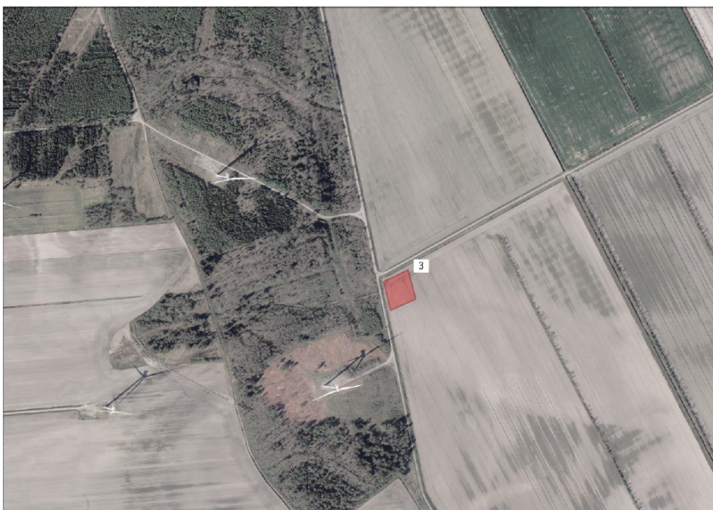
Figur 4 Oversigtskort over decentral oplagsplads 3