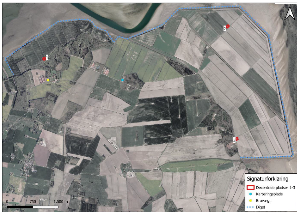
Figur 1 Oversigtskort med angivelse af de tre decentrale oplagspladser