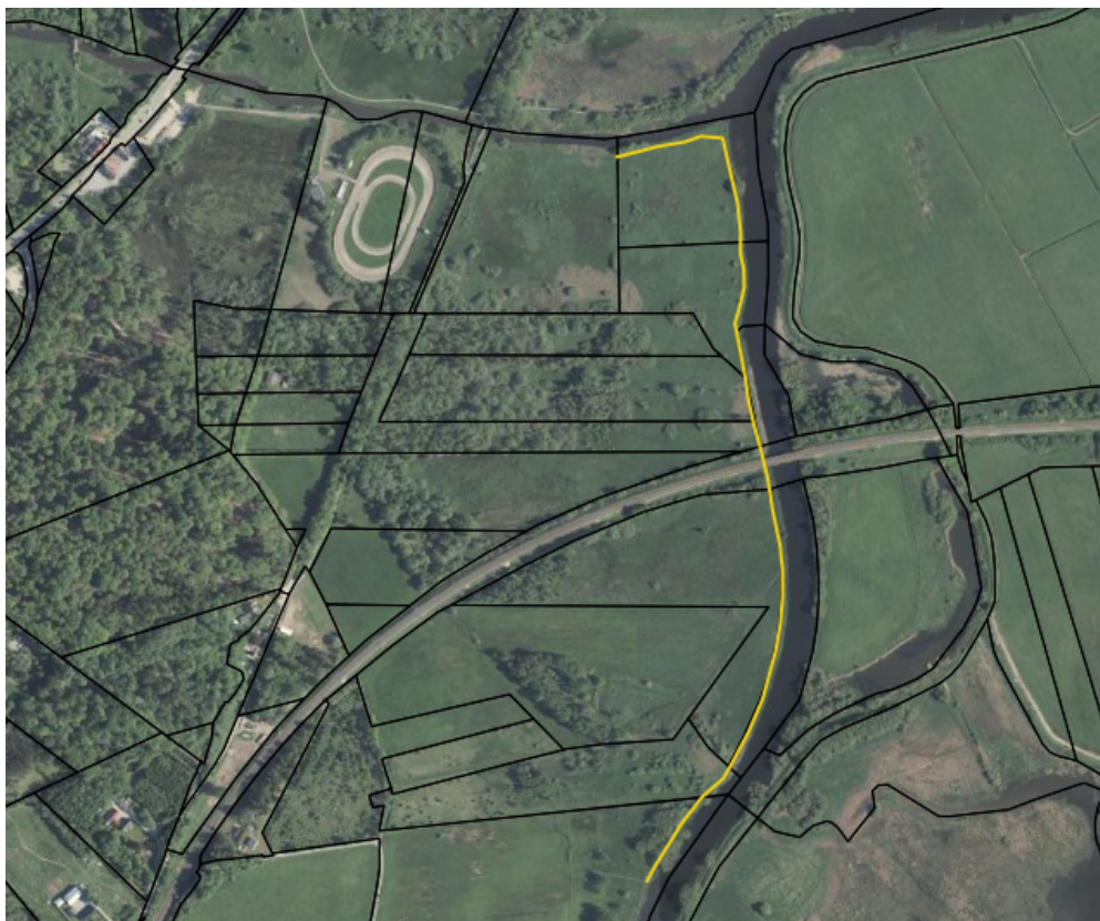
Billede 2: Placering af træsti vist med gul streg.