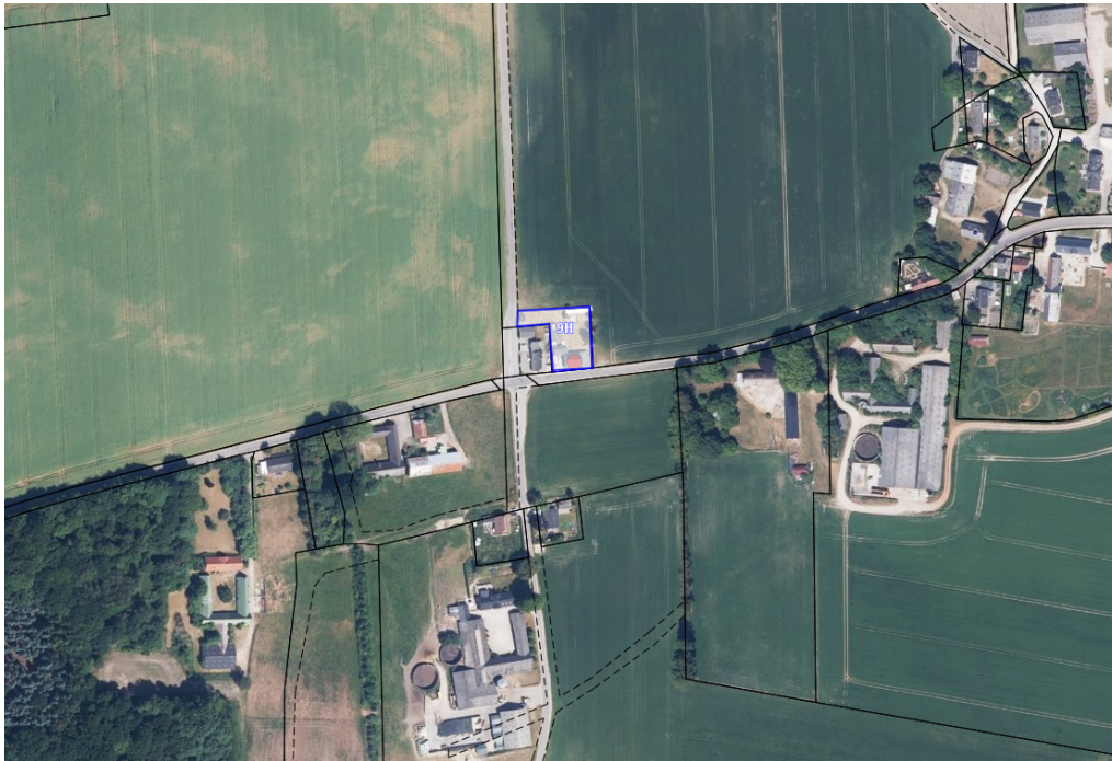
Luftfoto fra 2023, der viser ejendommens placering i landskabet

Du får hermed landzonetilladelse til at opføre en garage på 81 m 2 på matr.nr. 9H Floes By, Virring beliggende Grundvej 3, 8960 Randers SØ.