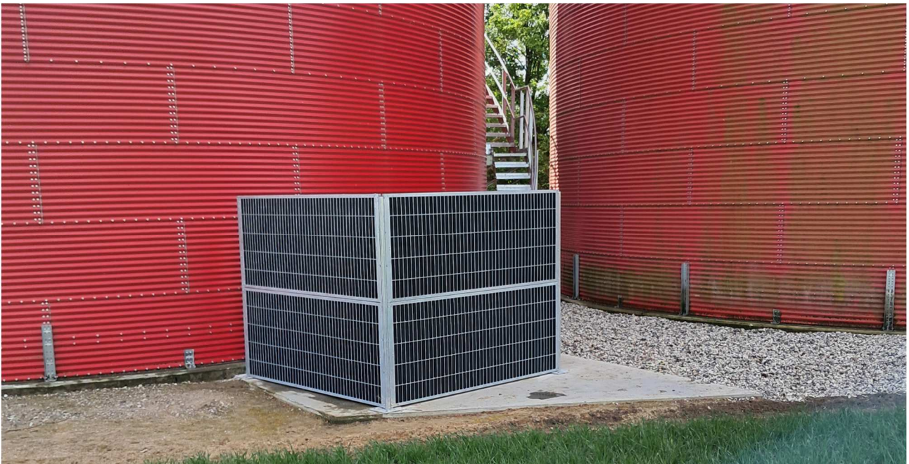
Støjdæmpende hegn omkring blæser ved silo 3