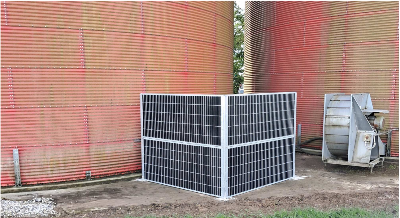
Støjdæmpende hegn omkring blæser ved silo 2. Bemærk blæser ved silo 1, som kun afskærmes ved brug