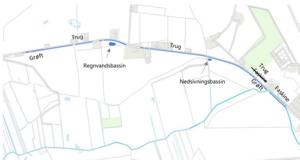
Billede 1 Oversigt over planlagt placering af afvandingsanlæg

Af nedenstående figur fremgår oversigt over anlæggene.